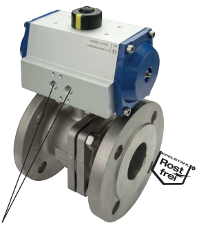
für Namuranschluss und IG