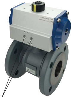
für Namuranschluss und IG