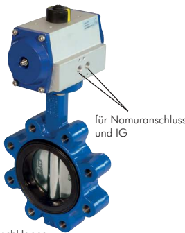
Anflanschklappe (mit Innengewinde)