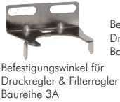
Befestigungswinkel für Druckregler & Filterregler Baureihe 3A