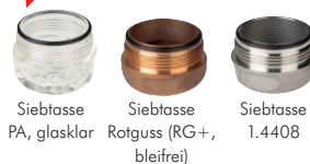
Siebtasse PA, glasklar Siebtasse Rotguss (RG+, bleifrei) Siebtasse 1.4408

Hinweis: Verwendbar für Filterdruckminderer Baureihe DRWG (PN 16) und DRWGH (PN 25).