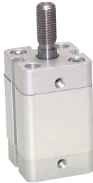
Kolbenstange mit Außengewinde